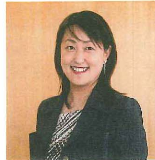
メディセレスクール 代表取締役社長

①自己認識力：自分の本当の気持ちを認識して大切に、自分が納得できる決断を下せる能力。